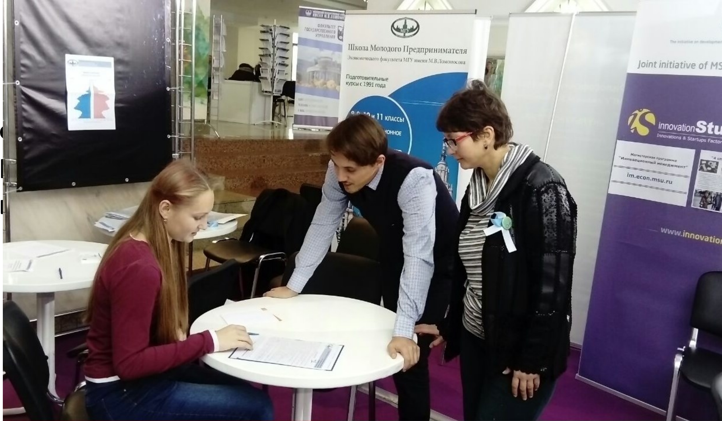
IX Валентеевские чтения 18-20 октября 2017