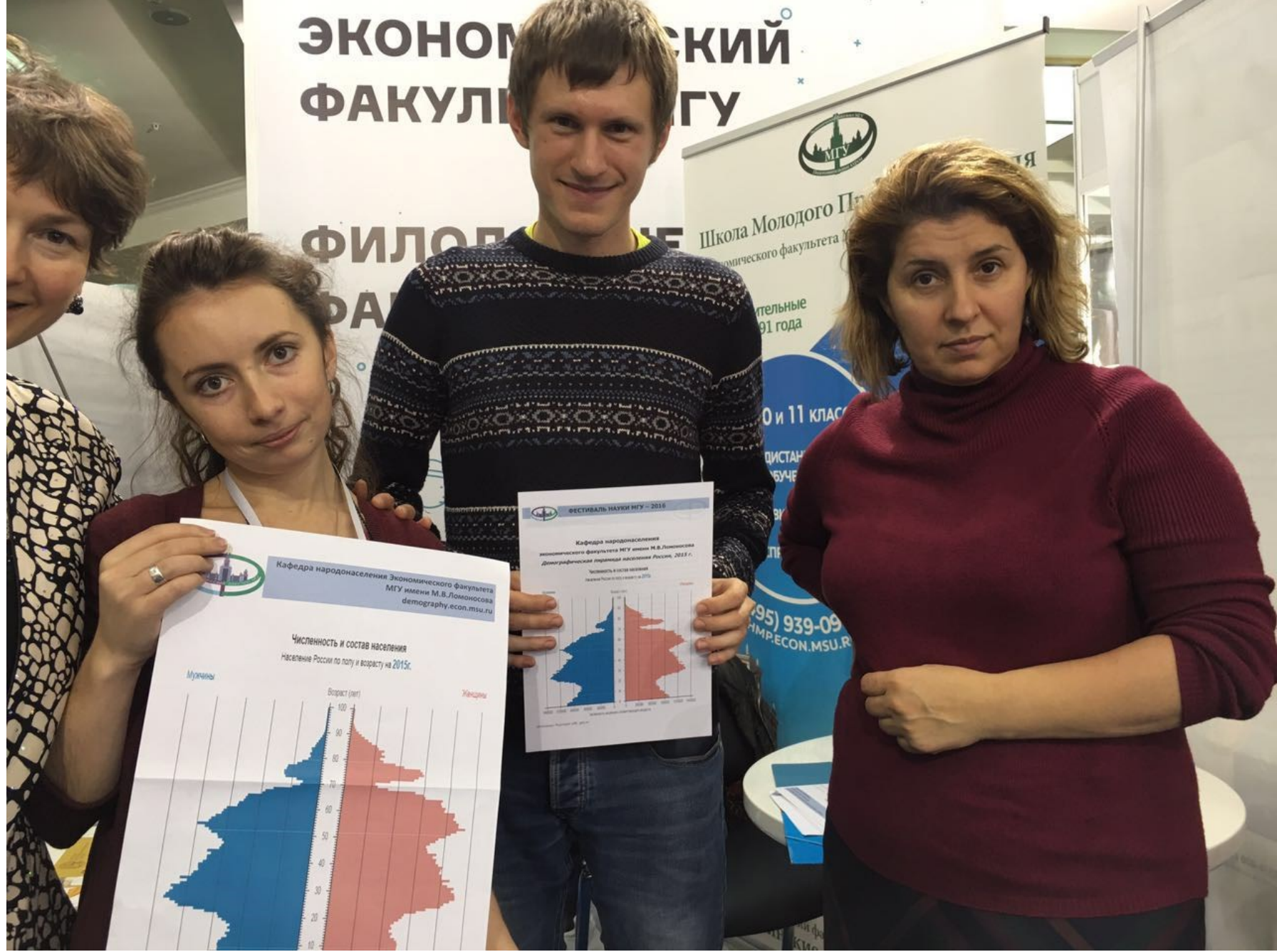
IX Валентеевские чтения 18-20 октября 2017